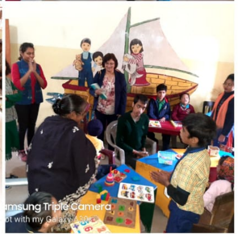
samsung Triple Camera Shot with my Galaxy A30s