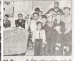
बच्चों का स्वास्थ्य जांच संपन्न