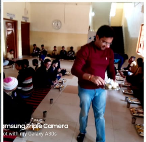
samsung Triple Camera Shot with my Galaxy A30s