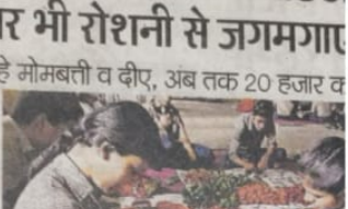
बच्चे तैयार कर रहे मोमबत्ती व दीए, अब तक 20 हजार क

पर देव्यांग बच्चों के बनाए अपनी आंगन सजाए। ताकि भी रोशनी से जगमगा उठे। श्रम विभाग, केकरबांध ने इस साल सजावटी दीयों की तैयारी करवा दी। इस बार बड़े दीयों के साथ-साथ छोटी दीयों की तैयारी करवा दी। इस बार बड़े दीयों के साथ-साथ छोटी दीयों की तैयारी करवा दी।