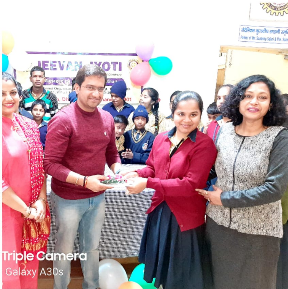
Triple Camera Galaxy A30s