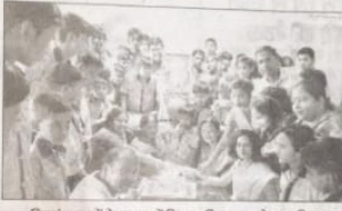
देव्यांग बच्चों के स्कूल में शिक्षक दिवस मनाते छात्र-शिक्षक