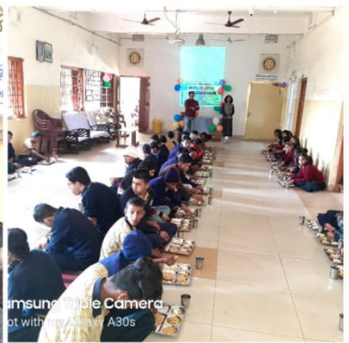
samsung Triple Camera Shot with my Galaxy A30s