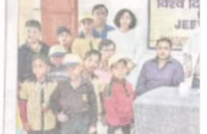
बच्चों ने पिकनि